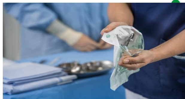
Nakládání s odpadem

Pokud v souvislosti se sáčky nebo rolemi dojde k jakékoliv závažné události, je třeba ji nahlásit společnosti Wipak a odpovídajícímu vnitrostátnímu orgánu, ke kterému uživatel přísluší.